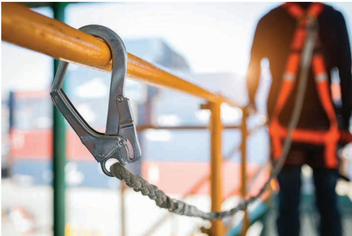
Linha de vida