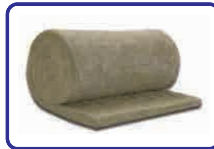
Lã de Rocha